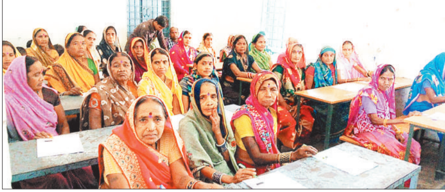
केन्द्र में परीक्षा दिलाती महिलाएं।

उल्लास नव भारत साक्षरता कार्यक्रम अंतर्गत जिले में महापरीक्षा का आयोजन रविवार 22 मार्च को किया गया। राज्यव्यापी बुनियादी साक्षरता एवं संख्यात्मक ज्ञान मूल्यांकन परीक्षा का आयोजन ग्राम पंचायत एवं नगरीय निकाय के स्कूलों में को किया गया। राष्ट्रव्यापी महापरीक्षा अभियान के लिए सभी स्कूलों को परीक्षा केन्द्र बनाया गया था। सुबह 10 बजे से परीक्षा प्रारंभ हुई जो शाम 5 बजे तक जारी रही। लोग अपनी सुविधा के अनुसार परीक्षा में शामिल होने पहुंचे। जिले में 440 परीक्षा केन्द्रों में 440 केन्द्राध्यक्ष एवं 440 पर्यवेक्षक की ड्यूटी लगायी गयी। राज्यव्यापी महापरीक्षा अभियान आयोजित परीक्षा में 200 घण्टे का अध्यापन पूरा करने वाले 17112 महिला एवं 7264 पुरुष कुल 24376 शामिल हुए। जिसमें महिलाओं की विशेष भागीदारी रही। महापरीक्षा में यह साबित कर दिया कि शिक्षा की राह में उम्र कोई बाधा नहीं बन सकती हर वर्ग विशेषकर महिलाएँ पूरी ऊर्जा और संकल्प के साथ आगे बढ़ रही